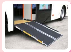
スロープ板装着時